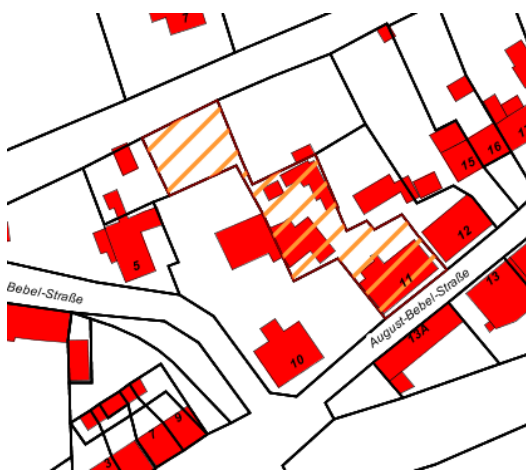
Lageplan auf der Grundlage der topographischen Karte TOP 50 des LVermGeo LSA

Lage: Die Ortschaft Kehnert liegt im südlichsten Teil der Einheitsgemeinde Stadt Tangerhütte direkt an der Elbe.